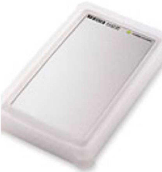
ポータブルハードディスク