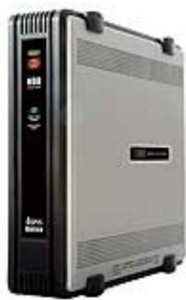
(外付け)ハードディスク