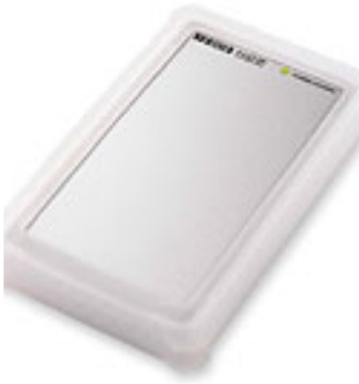
ポータブルハードディスク